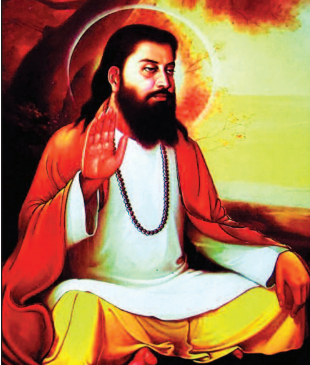
ਸ੍ਰੀ ਗੁਰੂ ਰਵਿਦਾਸ ਟੈਪਲ, ਯੂਬਾ ਸਿਟੀ ਦੀ ਪ੍ਰਬੰਧਕ ਕਮੇਟੀ ਅਤੇ ਸਮੂਹ ਸਾਧ ਸੰਗਤ ਵੱਲੋਂ 10 ਅਪ੍ਰੈਲ 2022 ਨੂੰ ਮਨਾਏ ਜਾ ਰਹੇ ਸ੍ਰੀ ਗੁਰੂ ਰਵਿਦਾਸ ਜੀ ਦੇ 645ਵੇਂ ਪ੍ਰਕਾਸ਼ ਪੁਰਬ ਅਤੇ ਪਹਿਲੇ ਨਗਰ ਕੀਰਤਨ ਦੀਆਂ ਸਮੂਹ ਸੰਗਤ ਨੂੰ ਲੱਖ-ਲੱਖ ਵਧਾਈਆਂ।

ਮੁੱਖ ਸੰਪਾਦਕ : ਪ੍ਰੋਮ ਕੁਮਾਰ ਚੰਬਰ ਸੰਪਰਕ : 916-947-8920 ਫੈਕਸ : 916-238-1393 E-mail : deshdoaba@yahoo.com ਸੰਪਾਦਕ : ਤਰਸੇਮ ਜਲੰਧਰੀ