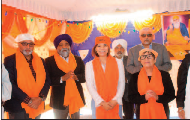
ਸ੍ਰੀ ਗੁਰੂ ਰਵਿਦਾਸ ਸਭਾ ਬੇ-ਏਰੀਆ ਨੇ ਮਨਾਇਆ ਸਤਿਗੁਰੂ ਰਵਿਦਾਸ ਜੀ ਦਾ 645ਵਾਂ ਪ੍ਰਕਾਸ਼ ਦਿਹਾੜਾ (ਰਿਪੋਰਟ ਅਤੇ ਤਸਵੀਰਾਂ ਦੇਖੋ ਸਫਾ 15 ਤੋਂ 19)